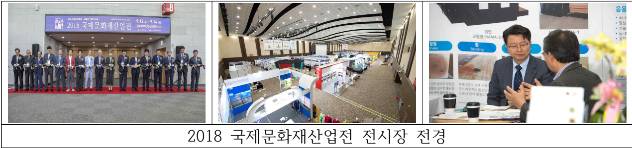
2018 국제문화재산업전 전시장 전경