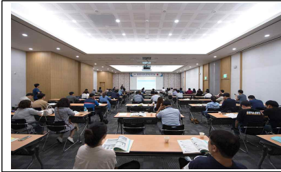
지자체 관계관 워크숍