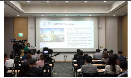
문화유산 ODA 세미나