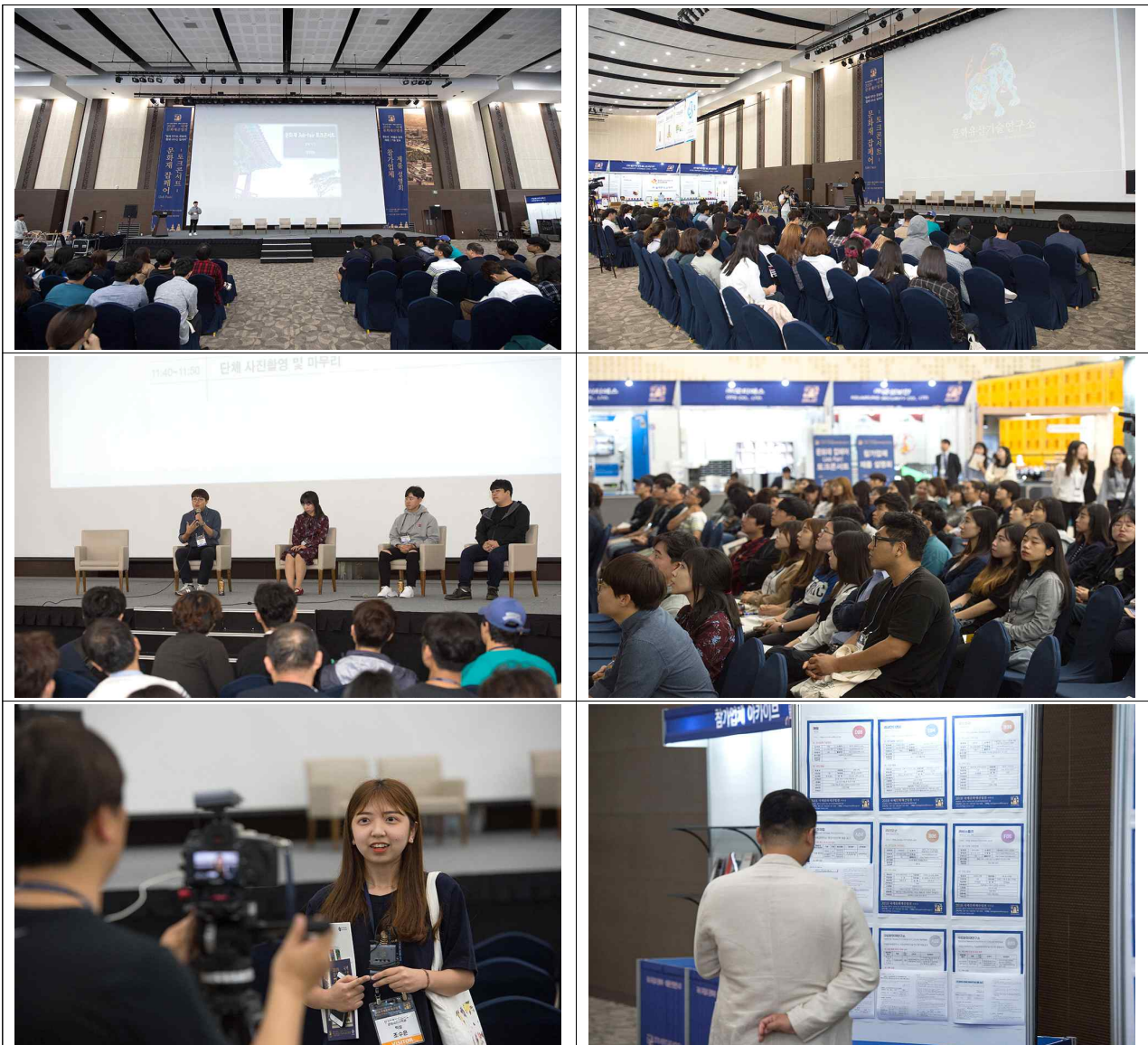
문화재 잡페어(Job Fair) - 토크콘서트 및 구인구직 게시판